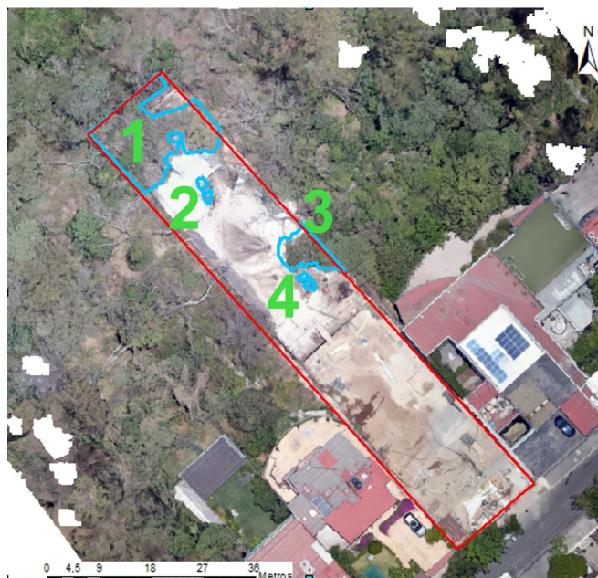
Análisis multitemporal de condiciones preexistentes el 29 de marzo de 2019