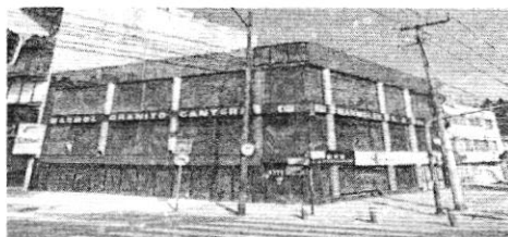
Google Maps Street View - diciembre 2024