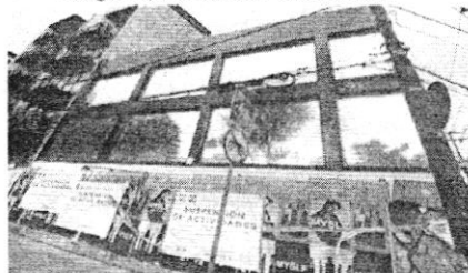
Fotografía tomada por personal adscrito a esta Subprocuraduría durante reconocimiento de hechos -25 de marzo de 2025