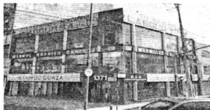
Google Maps Street View - octubre 2022

En este sentido, personal adscrito a esta Subprocuraduría, de conformidad con los artículos 21 y 25 fracción VIII de la Ley Orgánica de esta Entidad, y 56 antepenúltimo párrafo de la Ley de Procedimiento Administrativo de la Ciudad de México, de aplicación supletoria, a efecto de allegarse y desahogar todo tipo de elementos probatorios para el mejor conocimiento de los hechos sin más limitantes que las señaladas en la Ley de Procedimiento Administrativo del Distrito Federal, siendo que en los procedimientos administrativos se admitirán toda clase de pruebas, excepto la confesional a cargo de la autoridad y las que sean contrarias a la moral, al derecho o las buenas costumbres; en fecha 22 de abril de 2025, realizó la consulta al Sistema de Información Geográfica Google Maps, vía Internet ( http://www.google.com/earth/ ), y con ayuda de la herramienta Street View, en la cual se localizaron imágenes aéreas y a pie de calle, advirtiendo un inmueble de 3 niveles de altura preexistente, el cual no ha sufrido modificaciones estructurales, tal y como se observa en las siguientes imágenes: -----