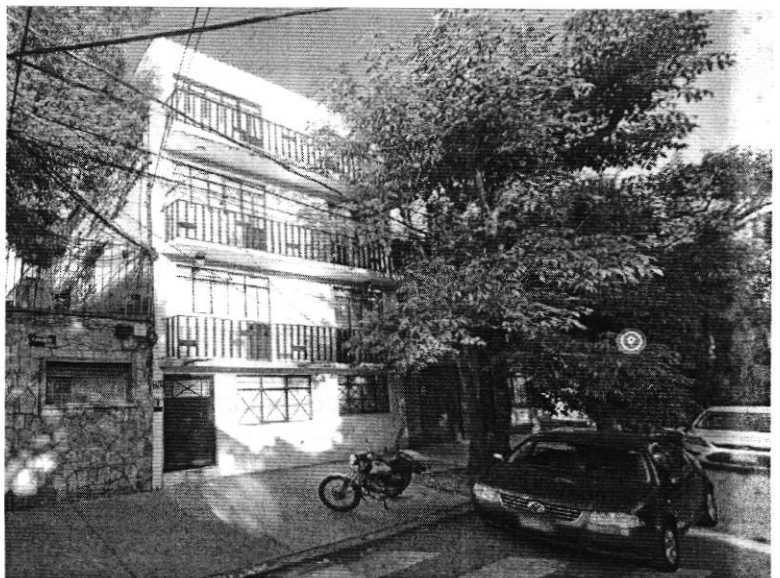
Imagen 3. Se observa el inmueble preexistente 4 niveles