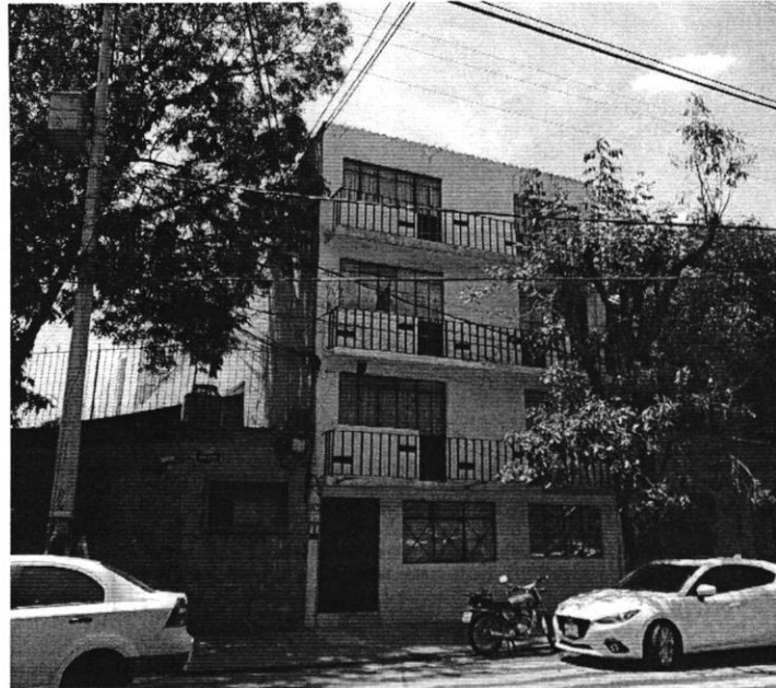
Imagen 4. Se observa el inmueble preexistente 4 niveles

Es importante señalar que, el artículo 22 BIS 2 de la Ley Orgánica de la Procuraduría Ambiental y del Ordenamiento Territorial de la Ciudad de México, establece que la denuncia sólo podrá presentarse dentro del plazo de un año, a partir de que se hubiera iniciado la ejecución de los actos, hechos u omisiones referidos en el artículo 22, o de que el denunciante hubiese tenido conocimiento de los mismos. -----