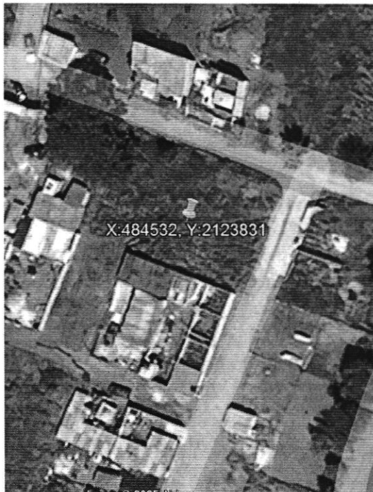
Octubre 2024