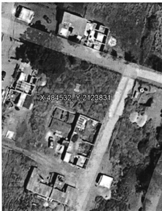
Septiembre 2023 Google Earth

Adicionalmente, personal adscrito a esta Subprocuraduría, de conformidad con los artículos 21 y 25 fracción VIII de la Ley Orgánica de esta Entidad, y 56 antepenúltimo párrafo de la Ley de Procedimiento Administrativo de la Ciudad de México, de aplicación supletoria, a efecto de allegarse y desahogar todo tipo de elementos probatorios para el mejor conocimiento de los hechos sin más limitantes que las señaladas en la Ley de Procedimiento Administrativo del Distrito Federal, siendo que en los procedimientos administrativos se admitirán toda clase de pruebas, excepto la confesional a cargo de la autoridad y las que sean contrarias a la moral, al derecho o las buenas costumbres; en fecha 04 de septiembre de 2025, realizó la consulta al Sistema de Información Geográfica Google Earth, vía Internet ( http://www.google.com/earth/ ), y con ayuda de la vista satelital, de diez meses a dos años del predio denunciado, se puede observar que desde septiembre de 2023, se encuentran diversos predios, tanto baldíos como con inmuebles y/o con construcciones en obra negra. Acta circunstanciada que tiene el carácter de documental pública y que se valora en términos de los artículos 327 fracción II y 402 del Código de Procedimientos Civiles para la Ciudad de México y 30 BIS de la Ley Orgánica de la Procuraduría Ambiental y del Ordenamiento Territorial de la Ciudad de México, tal y como se observa en la siguiente imagen: -----