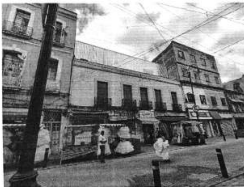
Vista del inmueble objeto de investigación.