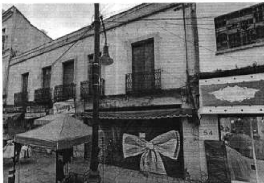
Vista del inmueble objeto de investigación.