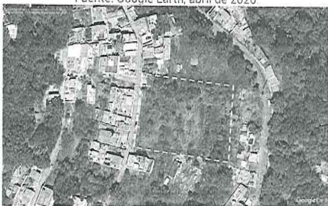
octubre de 2024.