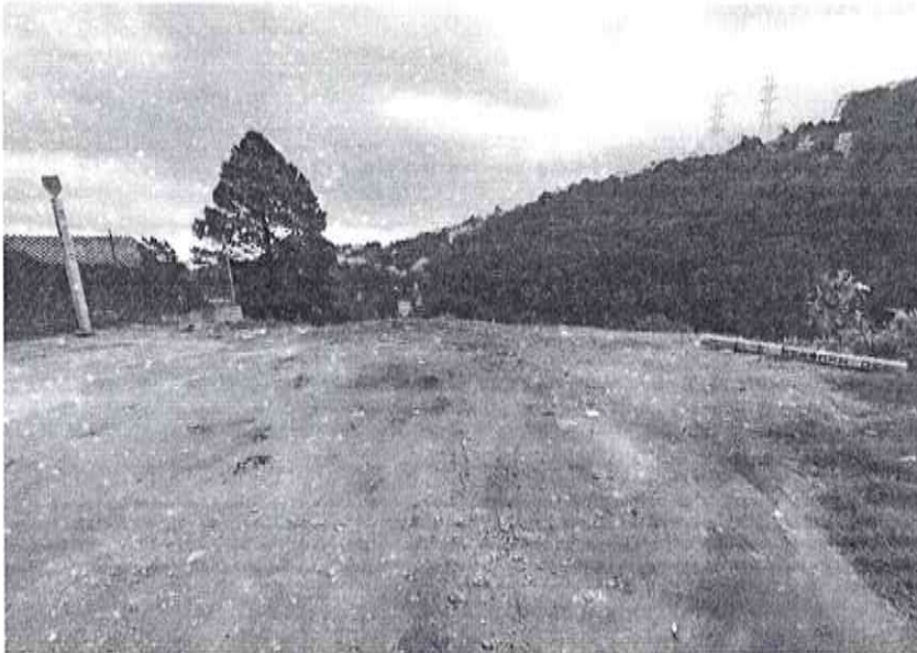
Fuente PAOT: Reconocimiento de hechos de fecha 06 de agosto de 2025.

Aunado a lo anterior, personal adscrito a esta Subprocuraduría, realizó análisis comparativo con imágenes satelitales obtenidas por medio del programa Google Earth, de las cuales se desprende que,