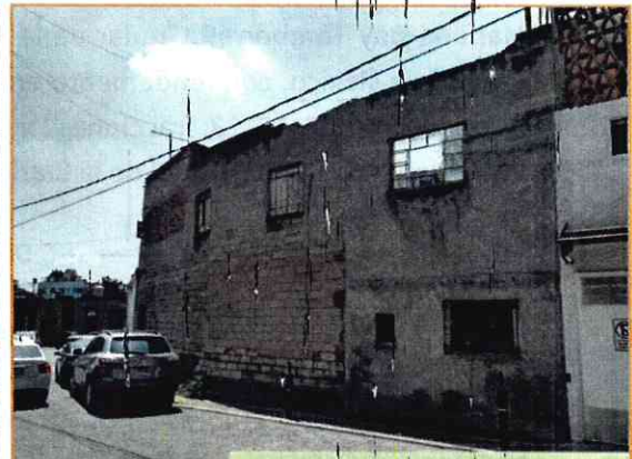
Vista de la parte posterior del inmueble