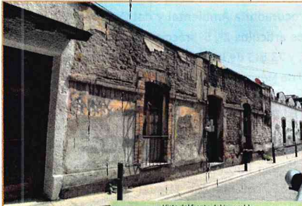
Vista del frente del inmueble

PROCURADURÍA AMBIENTAL Y DEL ORDENAMIENTO TERRITORIAL DE LA CIUDAD DE MÉXICO OFICINA DE LA PROCURADORA ACUERDO DE INICIO DE INVESTIGACIÓN DE OFICIO Expediente: PAOT-2024-101094-SOT