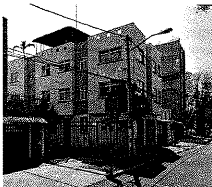
Imagen de Street View, Google Maps. Fecha: Marzo 2019