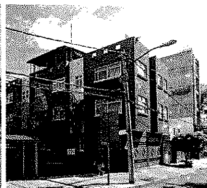
Fecha: Agosto 2022

En virtud de lo expuesto, se concluye que en el inmueble ubicado en Circuito Cuemanco Norte Mz.A-1 Lt.1, Colonia Barrio 18, Alcaldía Xochimilco, no se constataron trabajos de ampliación de construcción en el inmueble objeto de denuncia, por lo que existe una imposibilidad material para continuar con la denuncia que por esta vía se atiende, en términos de lo previsto en el artículo 27 fracción VI de la Ley Orgánica de la Procuraduría Ambiental y del Ordenamiento Territorial de la Ciudad de México. -----