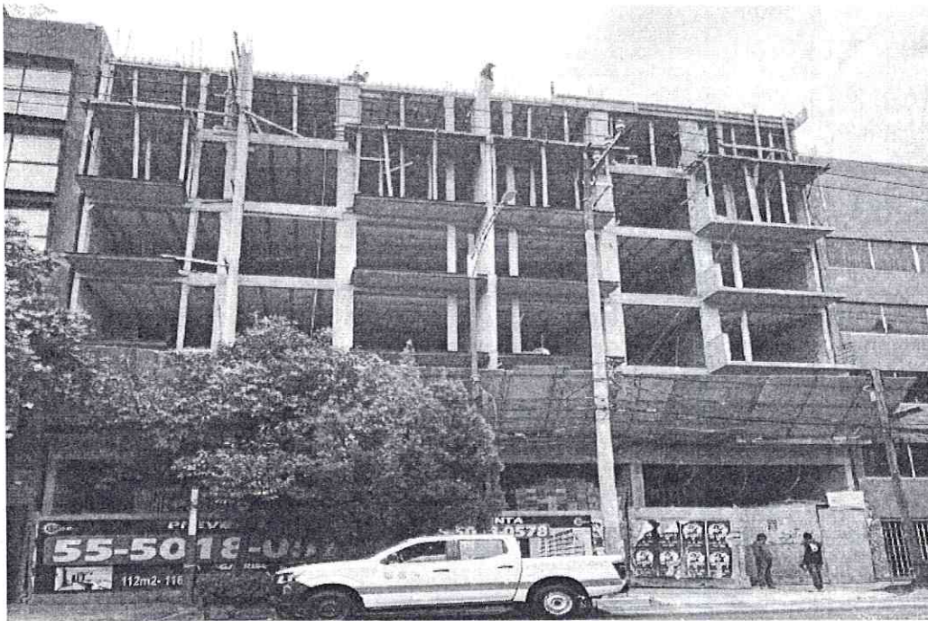
Fuente PAOT: reconocimiento de hechos de fecha 12 de junio de 2025.

En este sentido, durante la visita de reconocimiento de hechos realizada por personal adscrito a esta Subprocuraduría en fecha 12 de junio de 2025, se observó un cuerpo constructivo en obra negra de 6 niveles visibles sin constatar actividades de obra, trabajadores, materiales, ni equipo de construcción, por lo que no se perciben emisiones sonoras. -----