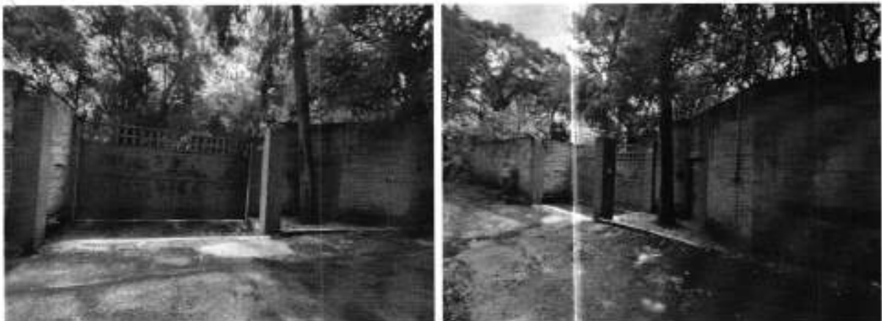
Fuente PAOT: reconocimiento de hechos de fecha 16 de octubre de 2025.

No obstante, en fecha 16 de octubre de 2025 personal de esta Entidad realizó una nueva visita de reconocimiento de hechos sin constatar los sellos referidos anteriormente, ni actividades de jardín y/o salón de fiestas y/o curso de verano. -----