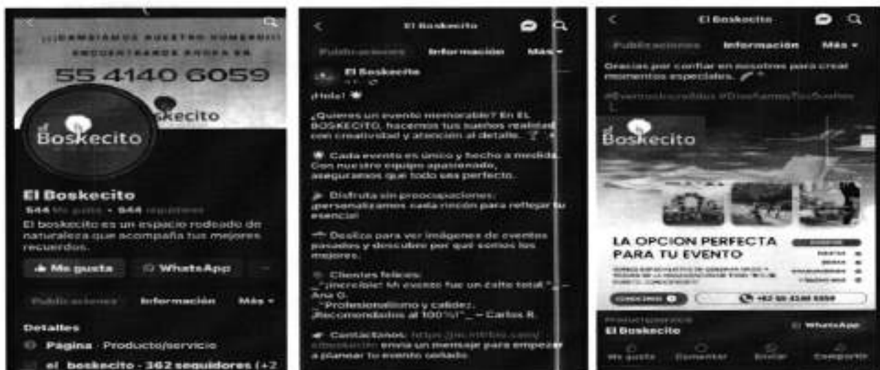
Fuente: Facebook, imagen de fecha 28 de julio de 2025.