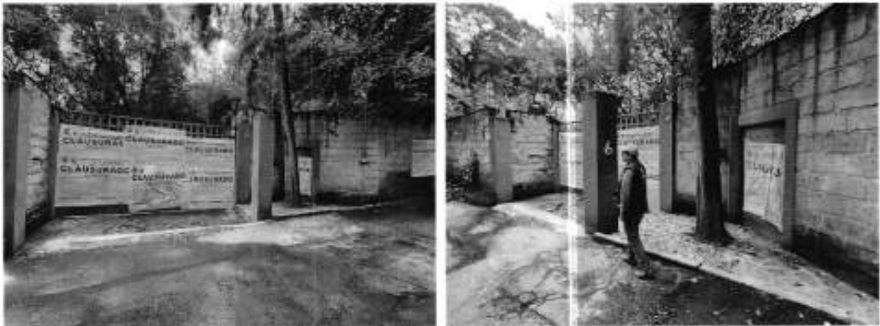
Fuente PAOT: reconocimiento de hechos de fecha 09 de septiembre de 2025.

vehicular y un acceso peatonal, con sellos de clausura impuestos por el Instituto de Verificación Administrativa de la Ciudad de México, de fecha 04 de septiembre de 2025, con número de expediente INVEACDMX/OV/DU/1631/2025, sin constatar rotulo, publicidad, actividades ni la obstrucción de la vía pública relacionadas con la operación de un jardín y/o salón de fiestas y/o curso de verano; asimismo, no se constató la descarga de aguas residuales ni emisiones sonoras. -----