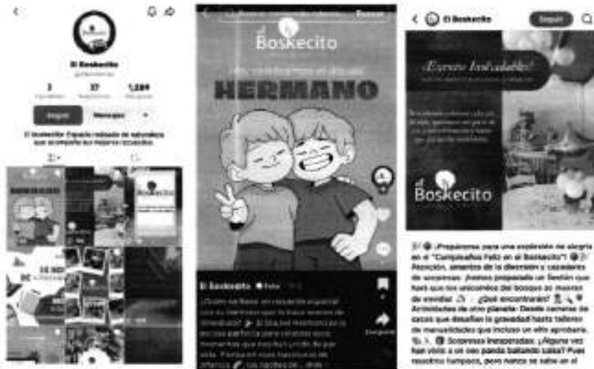
Fuente: TikTok, imagen de fecha 22 de octubre de 2025.

Adicionalmente, de las documentales que obran en el expediente, se tiene conocimiento que en el establecimiento denominado "El Boskecito" se ofrecen servicios de cursos de verano.