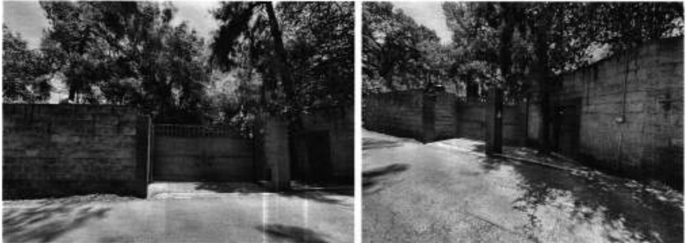
Fuente PAOT: reconocimiento de hechos de fechas 07 de mayo de 2024 y 16 de enero de 2025.

Expediente: PAOT-2024-2051-SOT-645 y acumulado PAOT-2025-4772-SOT-1492, PAOT-2026-1651-SOT-555