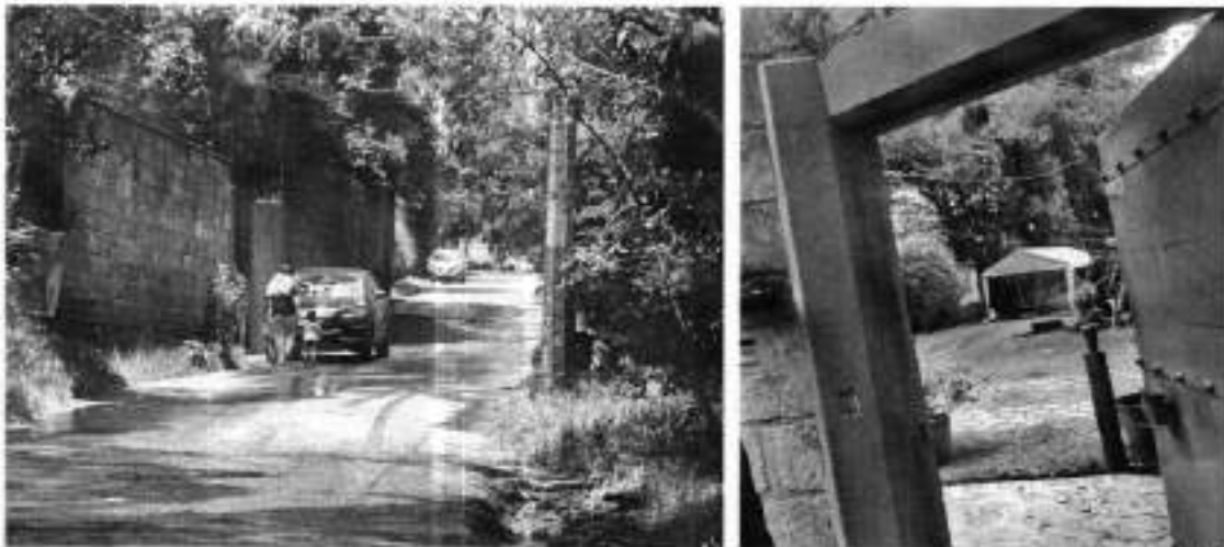
Fuente PAOT: reconocimiento de hechos de fechas 06 y 11 de agosto de 2025.

No obstante lo anterior, de las visitas de reconocimientos de hechos realizada por personal adscrito a esta Entidad en fechas 06 y 11 de agosto de 2025 se observó un predio delimitado por una barda perimetral, con acceso vehicular y un acceso peatonal, sin constatar rotulo ni publicidad relacionada con la operación de un jardín y/o salón de fiestas; sin embargo, se constató la entrada y salida de niños y se percibieron ruidos generados por voces de niños. -----