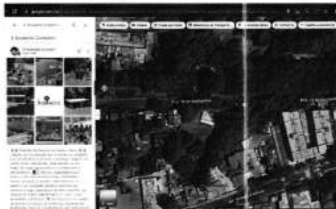
Imagen de fecha 28 de julio de 2025.

Aunado a lo anterior, de la consulta realizada por personal adscrito a esta Entidad en fechas 05 de marzo de 2024, 29 de enero, 28 de julio y 22 de octubre de 2025 a través del buscador "Google" se identificó publicidad relacionada con la operación de un salón y/o jardín de fiestas denominado "El Boskecito". Asimismo, de la consulta a las redes sociales "Facebook", "Instagram" y "TikTok" se identificó que en el predio de mérito opera un salón y/o jardín de fiestas denominado "El Boskecito" anunciando números telefónicos de contacto para la renta de dicho espacio, para la realización de diversos eventos, como cumpleaños y bodas con un aforo de hasta 100 personas; con domicilio en Calle Prolongación 16 de septiembre número 6, Colonia Contadero, Alcaldía Cuajimalpa de Morelos. -----