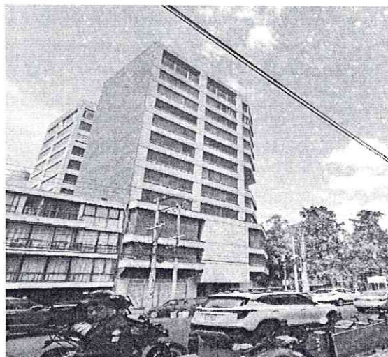
Fuente PAOT: reconocimiento de hechos de fecha 11 de junio de 2025.

En este sentido, es de señalar que el artículo 86 del Reglamento de Construcciones para la Ciudad de México, establece que, las edificaciones y obras que produzcan contaminación por ruido, entre otras, se sujetarán a dicho Reglamento, a la Ley Ambiental de la Ciudad de México y demás ordenamientos aplicables. -----